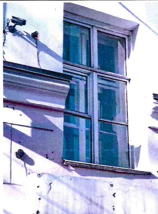
Фрагмент карниза первого этажа. Дворовой фасад

Профилированный карниз, отделяющий первый этаж от верхних, образованный трехступенчатым поясом, составленным двумя верхними узкими полочками, ниже расположенным профилем каблучка, поддержанным широкой полкой с выкружкой.