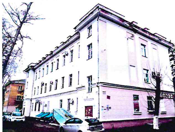
Общий вид здания с востока

Композиция главного северо-западного фасада: центрально-симметричная, трехчастная, сформированная широкими четырехосными фланговыми ризалитами, средней пятиосной частью, завершенной трехступенчатым аттиком и оформленной лоджией на два верхних этажа с 4-х колонным портиком большого коринфского ордера.