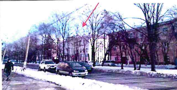
Общий вид здания с перекрестка улиц Аллея Труда и Севастопольской в застройке ул. Аллея Труда

Направления наилучших видовых раскрытий здания и его фрагментов в дальнем и ближнем секторах видимости: с ул. Аллея Труда, с перекрестков ул. Аллея Труда и Севастопольской, ул. Аллея Труда и просп. Мира.