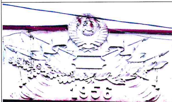
Фрагмент аттика. Барельефное изображение символики