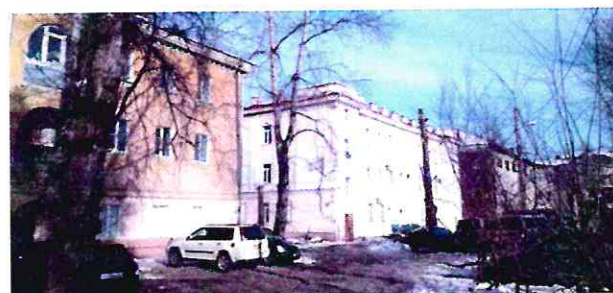
Общий вид здания с юго-запада, со стороны дворовой территории квартала