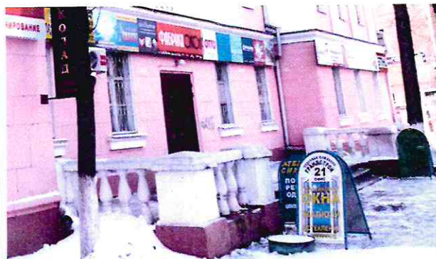
Крыльцо главного входа. Ограждение фланговых площадок

Трехступенное крыльцо большого выноса на всю ширину западающей части главного фасада с широким маршем в средней части и выступающими огражденными площадками на флангах. Ограждение площадок, состоящее из двух пролетов балюстрады, развернутых под прямым углом, заключенных между кубическими тумбами. Пролет балюстрады составлен пятью кувшинообразными балясинами. Тумбы поставлены на прямоугольные основания, имеют пирамидальные завершения, оформлены полками в виде карниза.