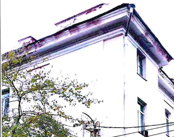
Фрагмент венчающего карниза

Венчающий профилированный карниз, раскрепованный по выступающим частям фасадов, оформленный в виде антаблемента стилизованного коринфского ордера, где прочитываются профили: выступающего архитрава, составленного нижней широкой и верхней узкой полками, соединенными выкружкой; западающего трехступенчатого фриза и карниза с далеко вынесенной карнизной плитой, оформленной сверху двухступенчатой тягой.