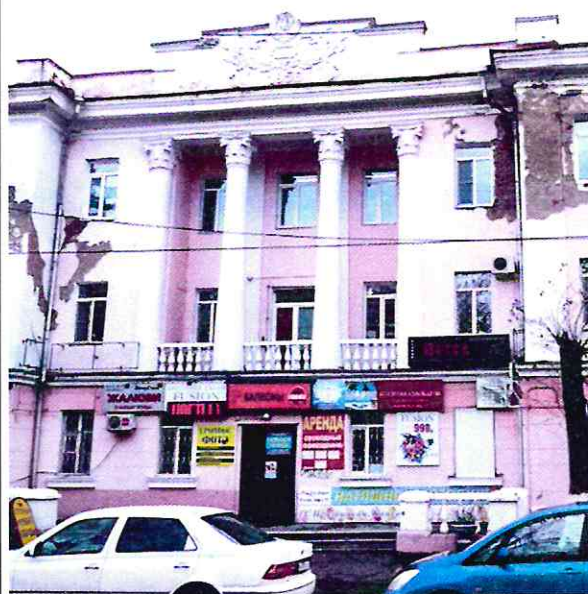
Фрагмент главного северо-западного фасада

Композиция идентичных торцовых фасадов: почти симметричная, составленная расположением в средней части каждого этажа оконного проема, фланкированного нишами, имитирующими оконные проемы.