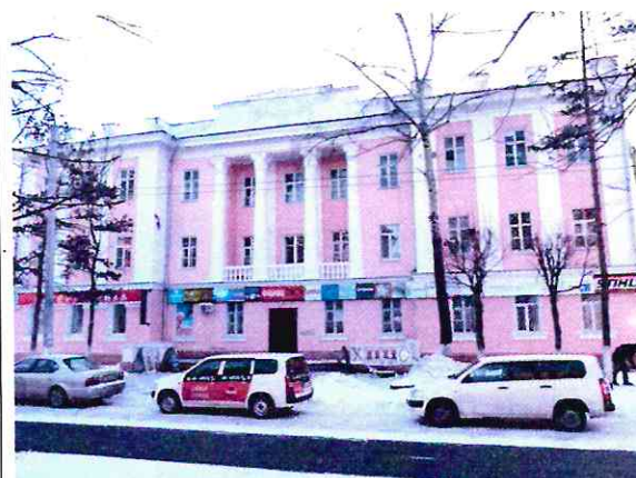
Фрагмент главного фасада