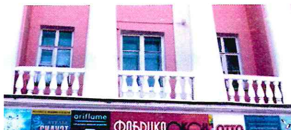
Балюстрада ограждения портика

- барельефное изображение с элементами советской символики: по оси сверху - выступающий за пределы верхней ступени аттика герб СССР на ниспадающей ленте, под