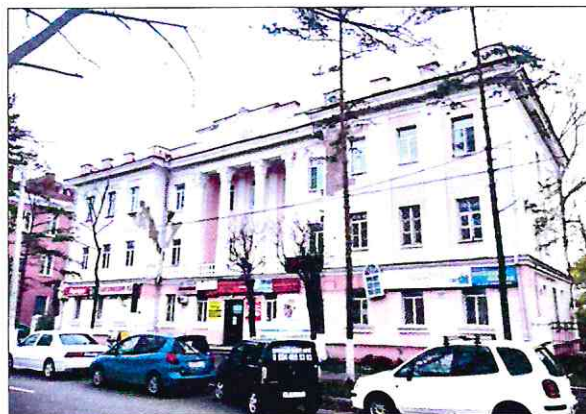
Общий вид здания с запада

Объемно-пространственная композиция трехэтажного здания с подвалом, завершеного вальмовой чердачной крышей, прямоугольного в плане с фланговыми ризалитами со стороны главного и дворового фасадов, в том числе конфигурация и размеры плана, этажность, высотные отметки карниза, конька крыши. Горизонтальные членения: раскрепованные по ризалитам карнизы - венчающий, междуэтажный и цокольный.